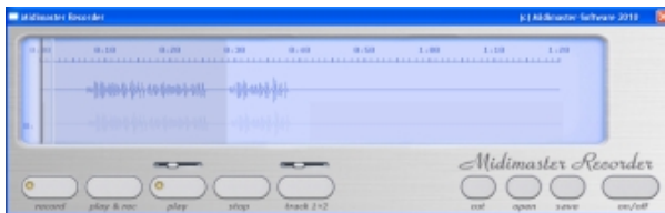
Abschneiden des Anfangs der Aufnahme